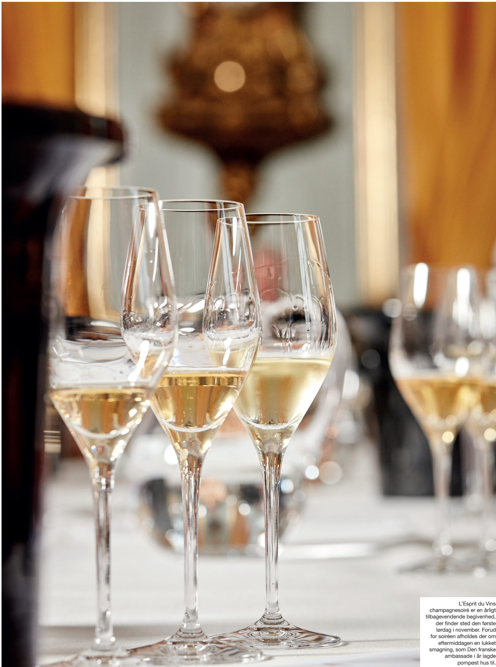
L'Esprit du Vins champagnesoiré er en årligt tilbagevendende begivenhed, der finder sted den første lørdag i november. Forud for soiréen afholdes der om eftermiddagen en lukket smagning, som Den franske ambassade i år lagde pompøst hus til.